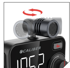
Directional Mic for cristal clear conversations