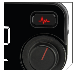
Active noise cancellation