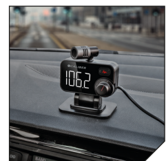
In car, on dashboard